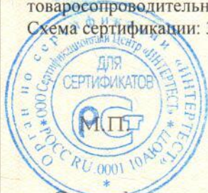
Схема сертификации: З.

Место нанесения знака соответствия: на изделии и в товаросопроводительной документации.